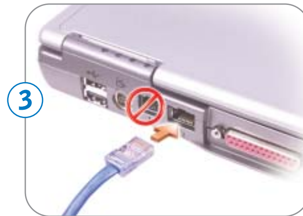
3 Network Réseau Red