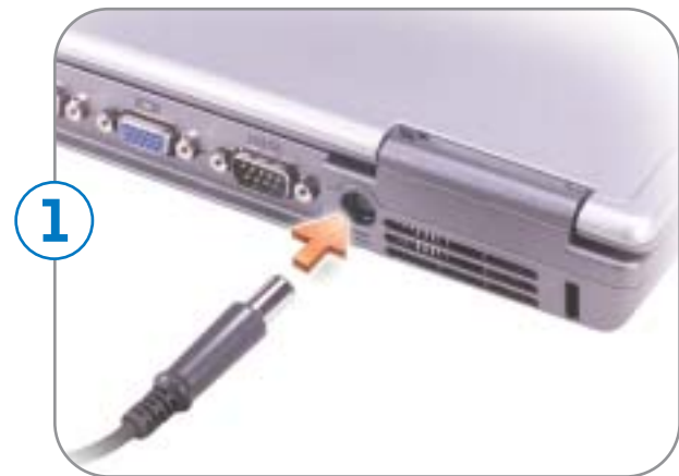
1 AC Adapter Adaptateur secteur Adaptador de CA

Antes de instalar y poner en funcionamiento el ordenador Dell™, lea y siga las instrucciones de seguridad de la Guía del propietario . Asimismo, consulte la Guía del propietario para obtener una lista de características completa.