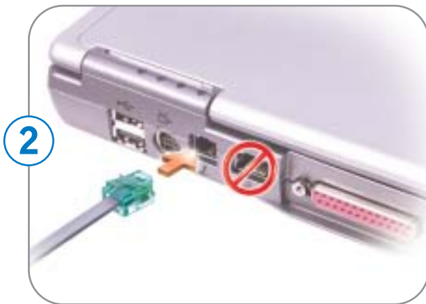
2 Modem Modem Módem