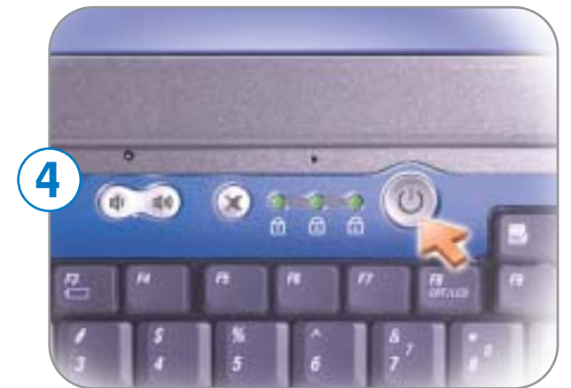
4 Power Button Bouton d'alimentation Botón de alimentación